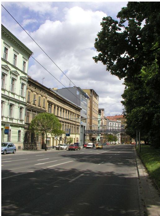
Obr.2 Koliště 29, fotografie – stávající stav, [4]

Nový architektonický návrh plně akceptuje charakter návrhu od stavitele Otto Eislera. Obdobné řešení stavitel Otto Eisler uplatnil při řešení zastřešení objektu situovaného na ulici Koliště, v Brně.