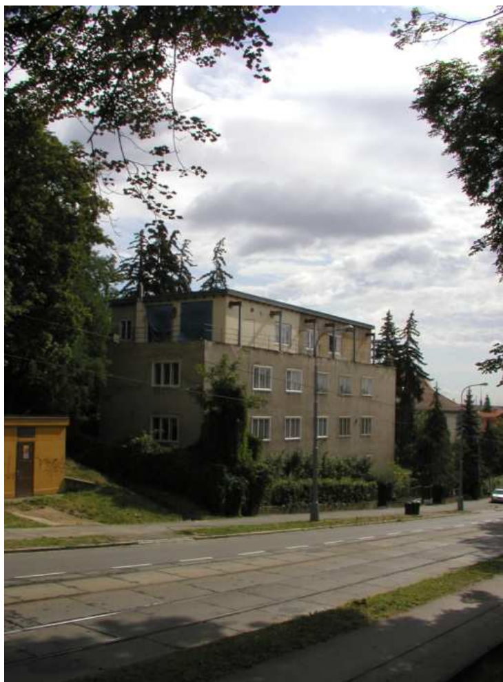
Obr.4 Údolní 72, Brno, pohled uliční – nový stav, [4]

Aby nedocházelo ke kondenzaci vodních par v střešní konstrukci byla navržena tato skladba: